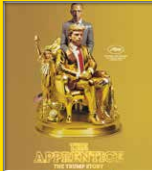
2.+3.Wo Regie: Ali Abbasi, US/CA/DK/IE 2024, 120 Min., FSK 12