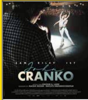
6.Wo Sa, 9.11., 11:15 Regie: Joachim A. Lang, DE 2024, 133 Min., FSK 12