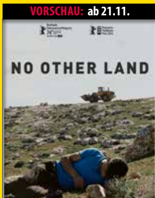
Berlinale 2024: Gewinner Bester Dokumentarfilm, Panorama Publikumspreis (Dokumentarfilm).