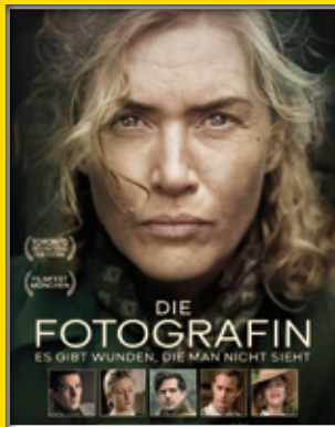
7.Wo Sa, 9.11., 11:00 Regie: Ellen Kuras, GB 2023, 117 Min., FSK 12