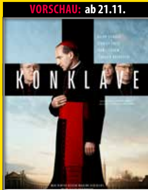
VORSCHAU: ab 21.11. Der neue Film von Oscar-Preisträger Edward Berger („Im Westen nichts neues“)